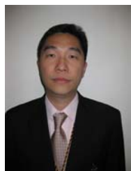
Albert Ho Surintendant du Bureau des plaintes contre la police de Kowloon Police de Hong Kong

Ensuite, en 2003, il a commencé son travail avec le « Independent Police Conduct Authority (IPCA) ». Dans le cadre de ses fonctions, il a travaillé deux fois avec les Nations Unies et plus récemment (de juin à septembre 2008), il a conduit l'enquête sur la violence postélectorale au Kenya.